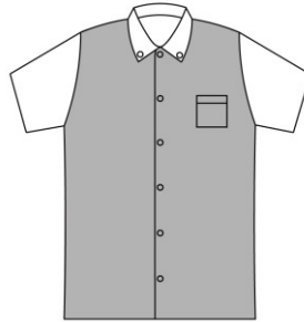
グレーの着色部分のデザインを募集します。 前見頃（全面・片側のみ問わず） デザインの向きは問わない